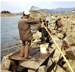
▲いさぎ漁(小浜市) 昭和55年3月25日