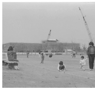
▲幾久公園 昭和58年3月27日